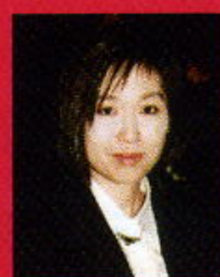
作曲家 徳山美奈子

韓伽倻(ピアノ) ニコラス・チュマチェンコ(ヴァイオリン) レナーテ・グライス-アーミン(フルート) ヴォルフガング・マイヤー(クラリネット) ラインホルト・フリードリヒ(トランペット) 徳山美奈子(作曲) / 東日本大震災レクイエム曲を世界初演