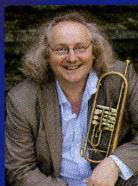
ラインホルト・フリードリヒ (トランペット)