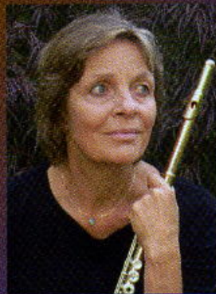
レナーテ・グライス-アーミン (フルート)