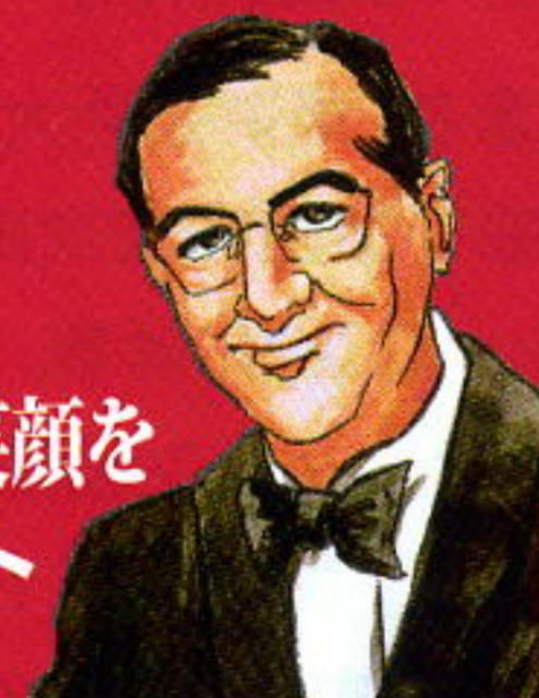
ベニーグッドマン