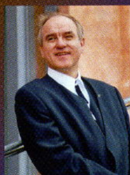
ヴォルフガング・マイヤー (クラリネット)