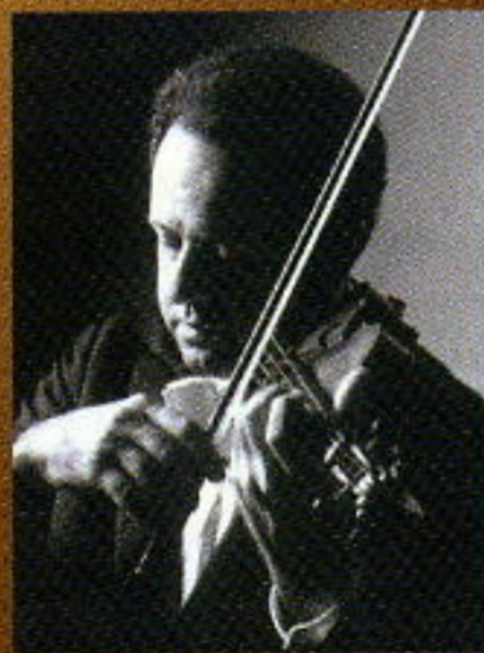
ニコラス・チュマチェンコ (ヴァイオリン)