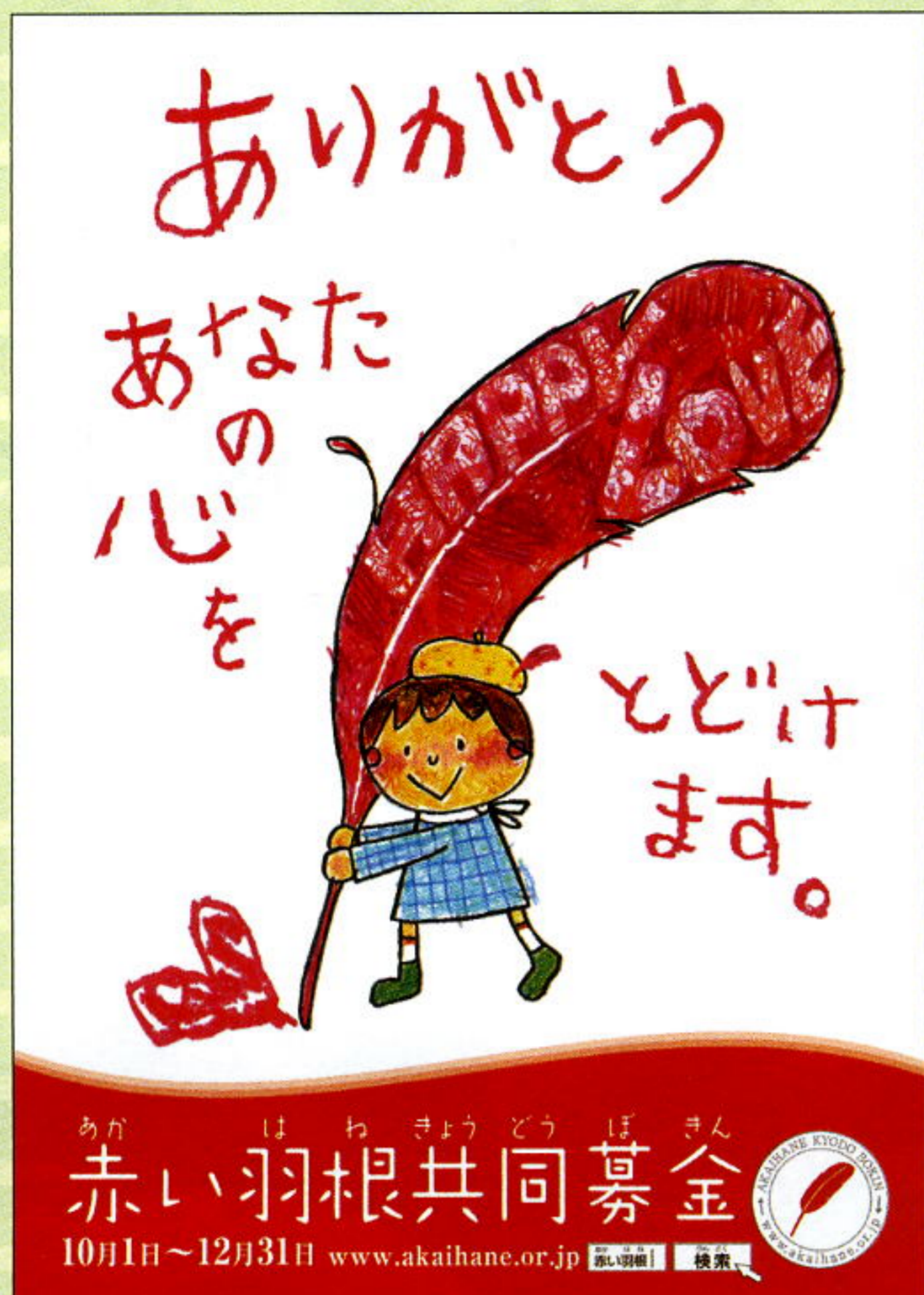
平成24年度近畿統一ポスター

今後、より一層の本県の地域福祉の推進に寄与できますよう、赤い羽根共同募金運動に皆様のご支援・ご協力をよろしく願います。