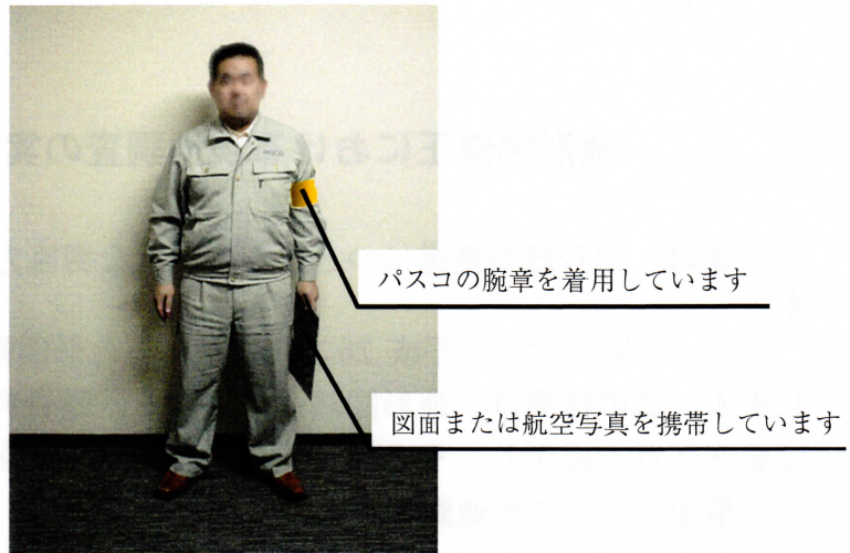
図2 作業員スタイルイメージ

作業員は、図2に示すスタイルで現地にて作業します。また、図3に示す生駒市発行の身分証明書を携帯しています。