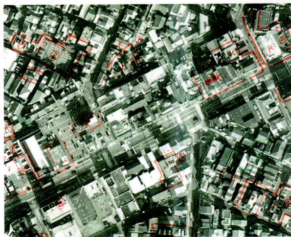
図1 現地調査結果書込みイメージ

現地に生駒市が撮影した航空写真を出力した大判図を携帯し、下記の項目を調査した結果を図1に示すような内容で書込み、地形図修正のための基礎資料を作成します。