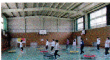
お手軽スポーツ【トランポボックス】

という特徴を持ち、地域の皆さんにより、自主的に自主財源で主に運営しているクラブです。