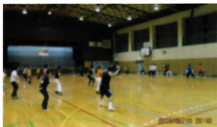
スポーツ女子会(男子もちょこっとコース)