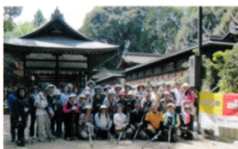
お手軽スポーツ【ノルディックウォーキング】