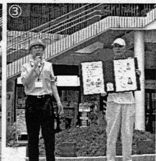
① 事業日当日の様子。多くの参加者で賑わいがあります。 ② 普段の活動では呼べない著名な講師との対局、大人はもちろん子どもにとっても貴重な経験になったようです。 ③ 今年度のマイサポいこま博覧会「マイサポいこま博覧会」での一場面。市民の皆さんへ事業をアピールしました。