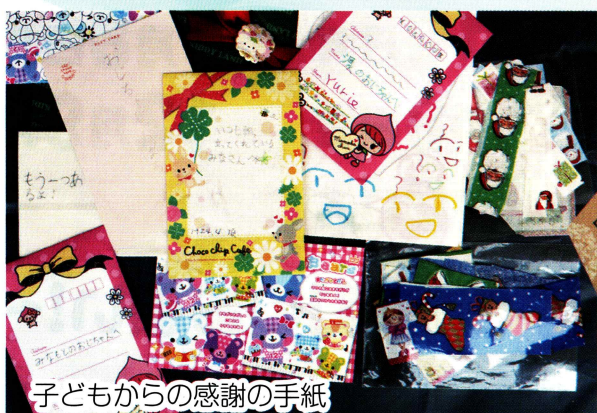
子どもからの感謝の手紙

「あいさつ」から生まれる心温まる交流、これがやまびこネットワークが目指す街づくり原点です。