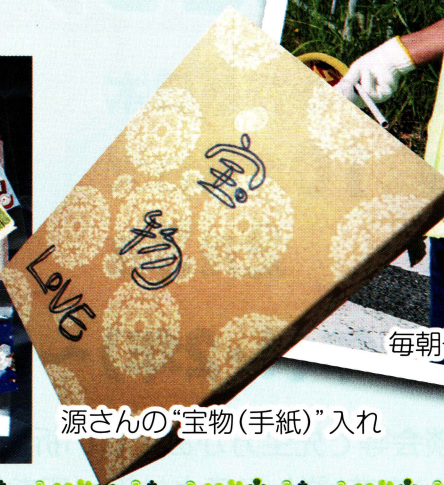
源さんの“宝物(手紙)”入れ