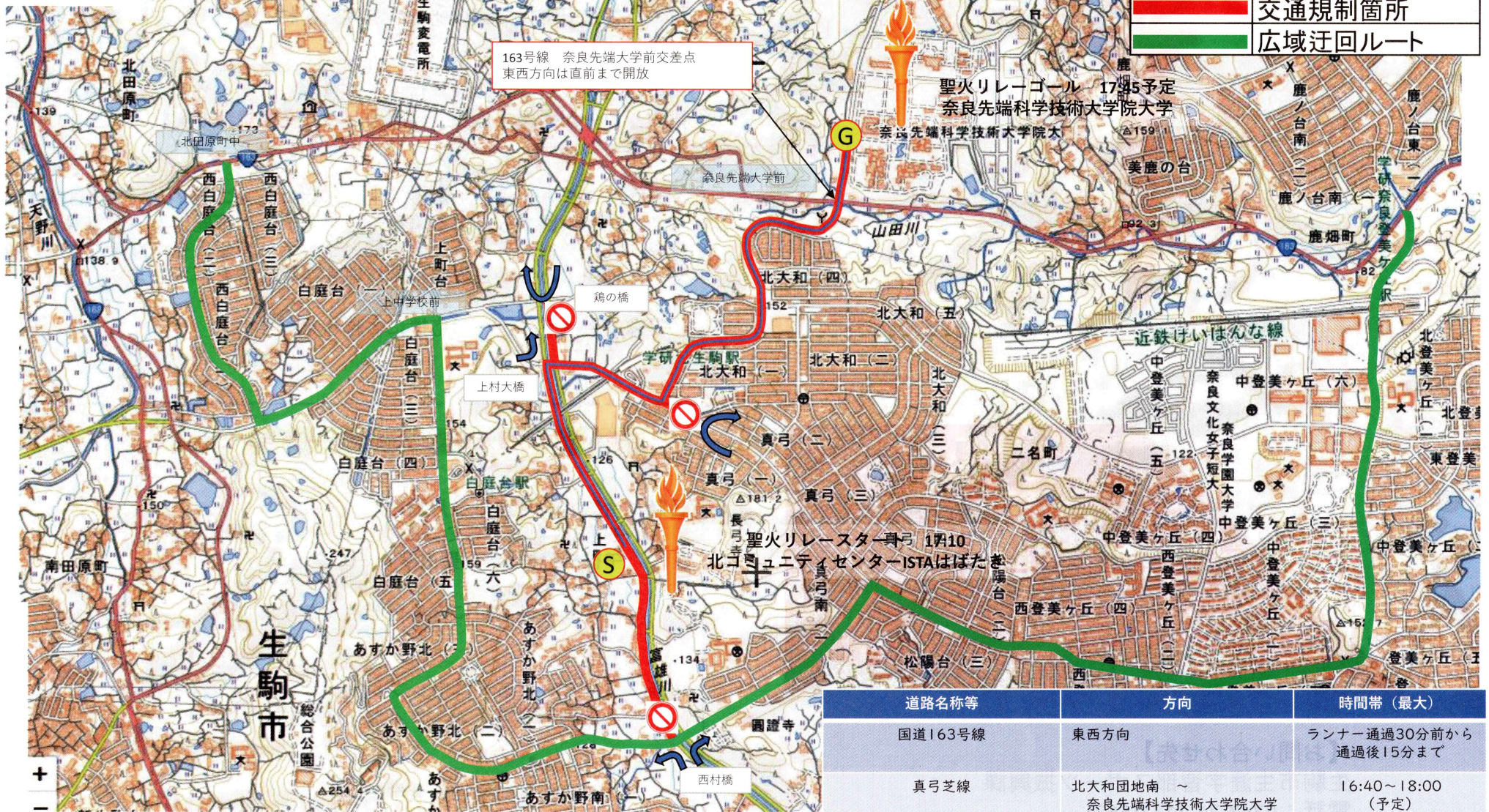
東京2020オリンピック聖火リレー 奈良県生駒市ルート