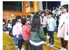
「ありがとうございました」

最後に、在校生からのメッセージを寄せた色紙を、1 年生から 6 年生に手渡し、心温まる会になりました。