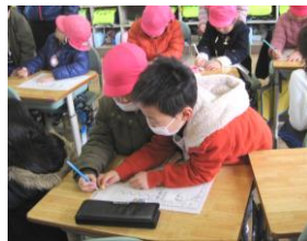
「こうやって書くんだよ」

あと一月余りで入学式です。新 1 年生が、小学校生活に夢と希望をもって入学してくれるのを、楽しみに待っています。