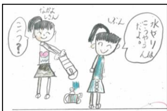
〈生活科のカードから〉

そして、5月に入って、生活科で植木鉢に朝顔の種を蒔く学習では、2年生が1年生に、種の蒔き方を教えました。